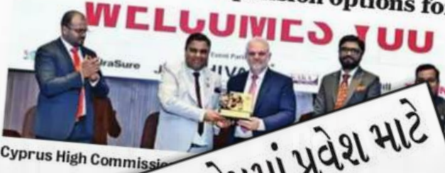
Cyprus High Commissioner... business... Europe...

Over 200 chartered accountants attended a seminar on India-Europe business opportunities organised by the Ahmedabad branch of the Western India Regional Council (WIRC) of the Institute of Chartered Accountants of India at ICAI Bhawan on Monday. The seminar focused on growing