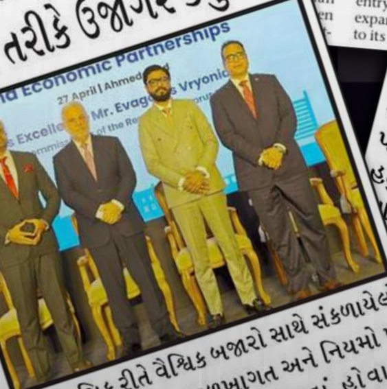
and Economic Partnerships... Mr. Evagoras Vryonides... Excellence of the Republic of Cyprus...

અમદાવાદ : વોટર એન્ડ શાર્ક યુરોપ ઇન્ડિયા સેન્ટર ફોર બિઝનેસ એન્ડ ઇન્વેસ્ટમેન્ટ સહયોગિતામાં, અમદાવાદની ડબલ ટ્રી બાય હિલ્ટન ખાતે "ઇન્ડિયા-E ઇકોનોમિક કોરિડોર" વિષય પર ઉચ્ચ-સ્તરીય વ્યાપાર અને રાજદ્વારી સંવાદનું આયોજન કરવામાં આવ્યું હતું. આ કાર્યક્રમમાં ગુજરાતની બિઝનેસ આયોજન કરવામાં આવ્યું હતું. આ કાર્યક્રમમાં ગુજરાતની બિઝનેસ આયોજન કરવામાં આવ્યું હતું. આ કાર્યક્રમમાં ગુજરાતની બિઝનેસ આયોજન કરવામાં આવ્યું હતું.